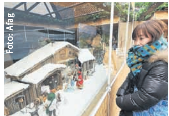
Immer einen Besuch wert: die Krippenausstellung im Handwerkerhof.

Krippenausstellung im Handwerkerhof: In der kleinen, romantischen Stätte handwerklicher Tradition erleben Sie neben einem Einkaufsbummel durch Läden und Werkstätten eine sehenswerte Krippenausstellung, die vom Verein Nürnberger Krippenfreunde organisiert wird. Die meisten Krippen wurden