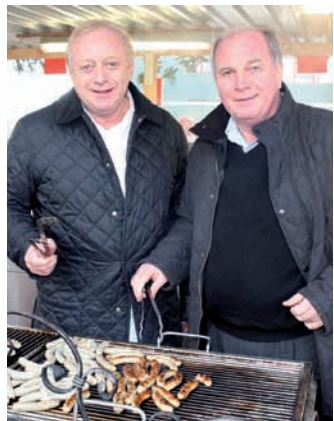
Experten am Bratwurst-Grill: Alfons Schuhbeck und Uli Hoeneß.

NÜRNBERG Großer Weihnachtsverkauf bei HoWe – und da steht Firmengründer Uli Hoeneß traditionell selbst mit am Grill! Am 14. Dezember (ab 10 Uhr) besucht der Präsident des FC Bayern das Werk in der Regenstraße 1 – und er hat gleich drei Fest-Attraktionen mit dabei: ganz besonders preiswerte Sonderangebote, eine große Weihnachtsverlosung – und den TV-bekanntesten Starkoch Alfons Schuhbeck, der ab 11 Uhr mit ihm zusammen grillt und seine Kochbücher signiert.