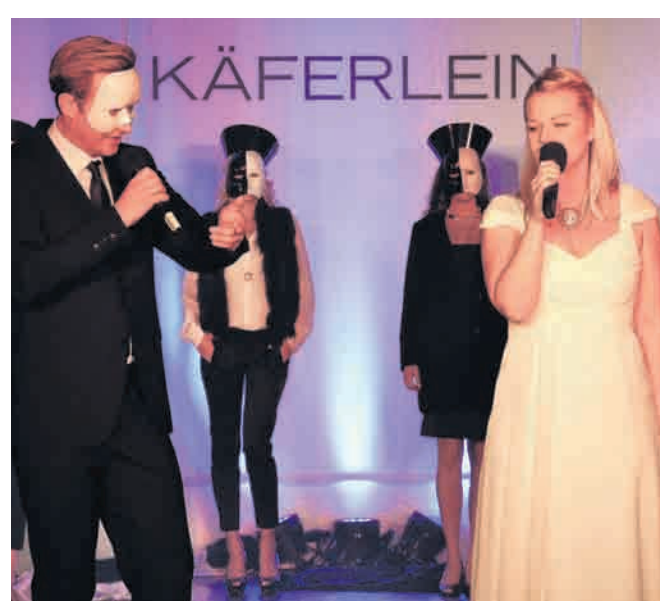
Mehr als eine Modenschau: die musikalische Fashion-Präsentation bei Käferlein.

Die Verkehrssicherheitsaktion wird seit 1956 vom Deutschen Kfz-Gewerbe und der Deutschen Verkehrswacht organisiert. Auch in diesem Jahr erwarten die Veranstalter bis zu zehn Millionen Teilnehmer.