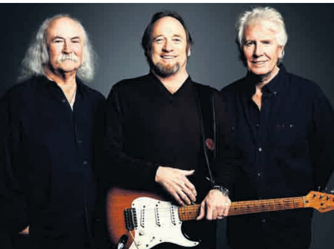
Folk-Legenden: David Crosby, Stephen Stills und Graham Nash (v. li.), die schon in Woodstock die Fans verückten.

Zeppelfeld locken, wenn Stars wie Selig, The Prodigy, Bad Religion und die Sportfreunde Stiller aufspielen. Zusagen gab es zuletzt auch von Limp Bizkit, Biffy Clyro und Bush sowie weiteren 20 Bands. Festivaltickets kosten 165 Euro – und wer dabei sein will, sollte sich beeilen: Schon mehr als 45.000 Karten sind verkauft. Und: Vorsicht vor inoffiziellen Ticket-Händlern: Häufig bekommt man dort gefälschte Eintrittskarten!