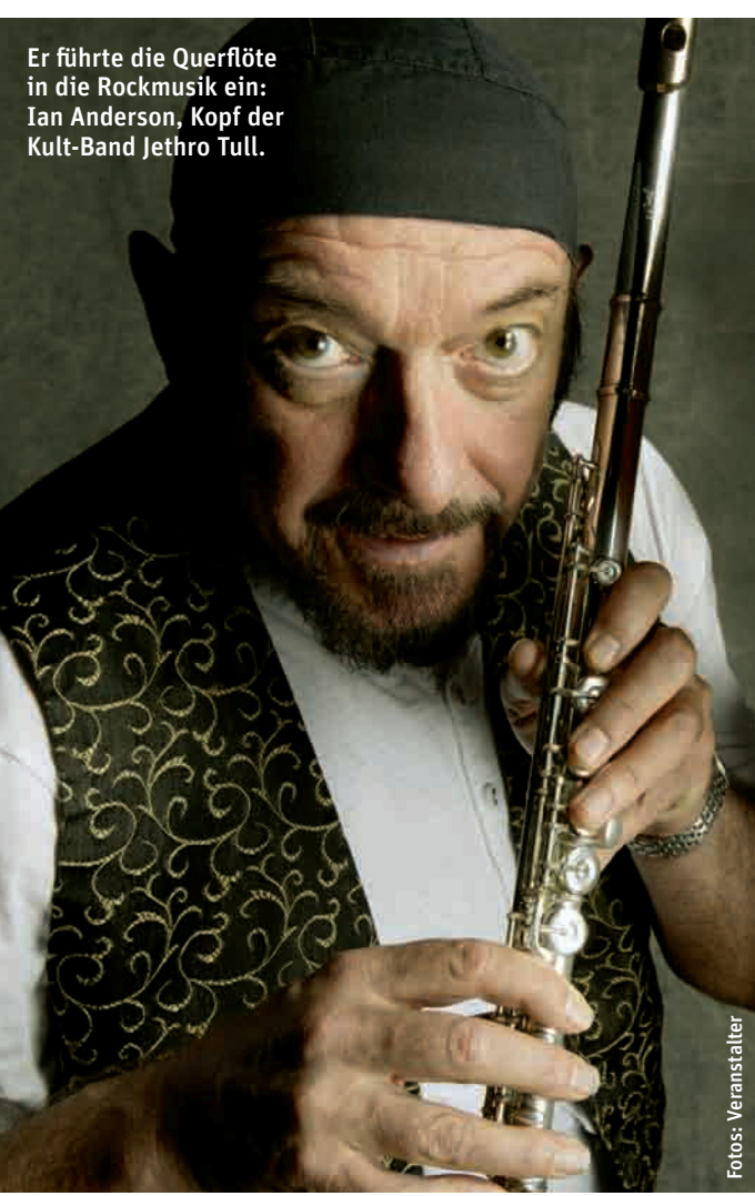
Er führte die Querflöte in die Rockmusik ein: Ian Anderson, Kopf der Kult-Band Jethro Tull.

Mit den „ Dire Straits “ („Sultans of Swing“) schrieb er Musikgeschichte, führte einen bis heute einzigartigen Gitar-