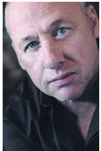
Gitarren-Legende: Mark Knopfler, Kopf der „Dire Straits“.